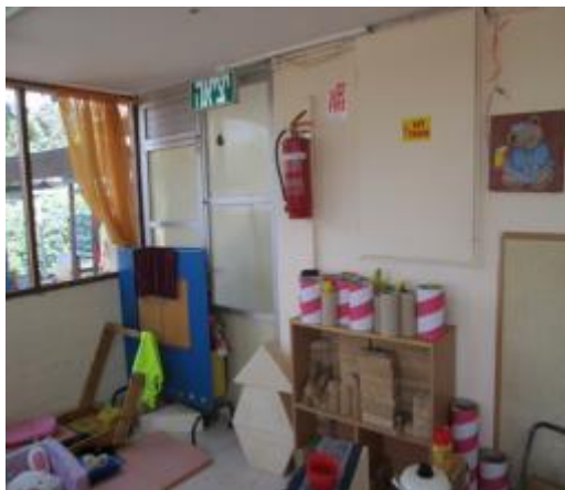
תמונה 2 : אולם הגן